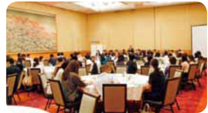
▲地区別懇談会 (京都①会場)