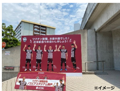
フォトスポット (ピッチサイドに設置)