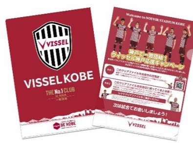
ヴィッセル神戸オリジナルクリアファイル