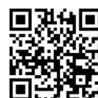
2025年度卒業式特設サイト