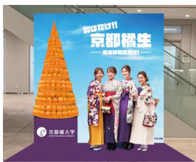
みかんタワーフォトスポット

また、卒業生から「たちばなで新生活を迎える新入生へのエール」を送るメッセージボード を設置します。このボードは入学式でも設置し、卒業生のエールを受けた新入生が、「4年後 にたちばなを卒業する自分へ」メッセージを書くことで、先輩学生から後輩学生へと、現在か ら未来につながっていくメッセージ企画です。