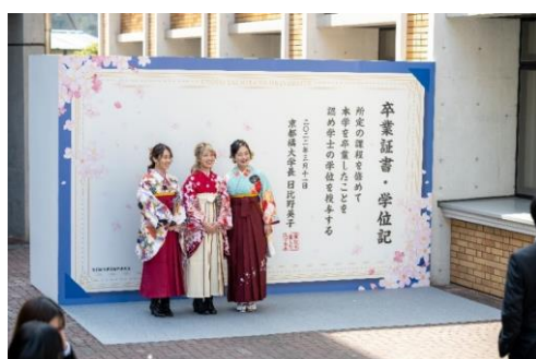
卒業証書フォトスポット