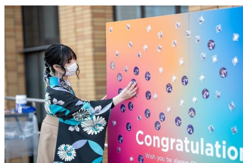
メッセージボード