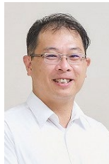
丹下 裕 教授