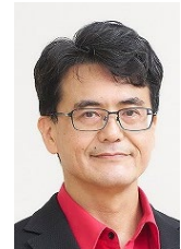
倉田 宜典 教授

専門分野 | ヒューマンロボットインタラクション、ヒューマンエージェントインタラクション、知能ロボティクス、ロボット情報学