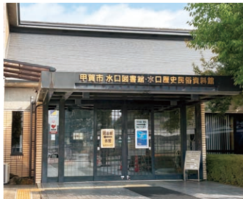
▲水口歴史民俗資料館