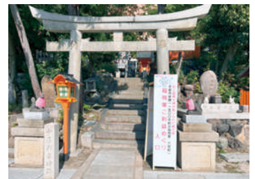
【折上神社境内古墳】

ルート 栂辻駅改札前(アートロードなぎつじ) ⇒中臣遺跡旧石器時代遺跡発見場所⇒折上神社 ⇒宮道古墳⇒坂上田村麻呂墓⇒栂辻駅にて解散