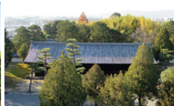
重要文化財 東福寺東司