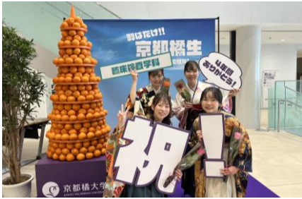
みかんタワーフォトスポット

このメッセージボードには、卒業生からの「たちばなで新生活を迎える新入生へのエール」も描かれていて、先輩学生から新入生へと、時を超えてつながっていく企画としています。