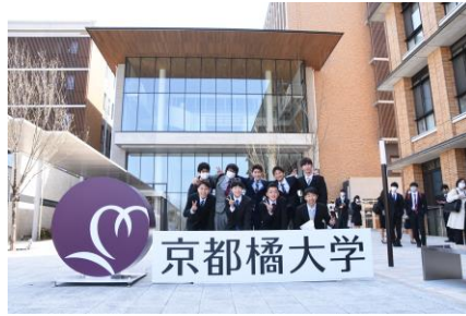
ロゴフォトスポット