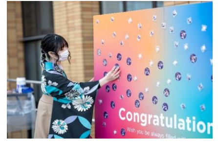
メッセージボード