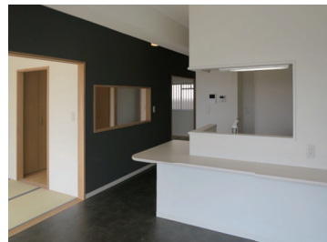
向島ニュータウン 子育て世代向け住戸 LDK

京都市営住宅の一部住戸を子育て世代向けにリノベーションする計画にゼミの学生を中心に研究室として協力の結果、2種類のプランを提案し実施案として採用されました。