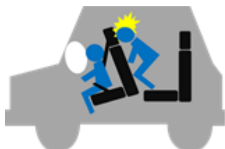
前の座席への衝突